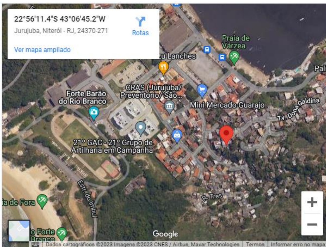
Figura 1 - Imagem Satélite

O presente memorial descritivo relata todos os procedimentos necessários para a obra de serviço de Revitalização de acessos na Comunidade Salinas, Jurujuba, Niterói/RJ.