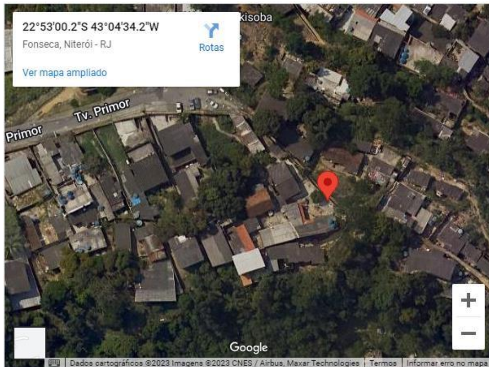
Figura 1 - Travessa Primor

Este memorial descritivo contém todos os procedimentos necessários para a Revitalização na Castro Alves, Fonseca – Niterói/RJ - Travessas: Primor, Antônio Alves, 01, 04, 06 e S.