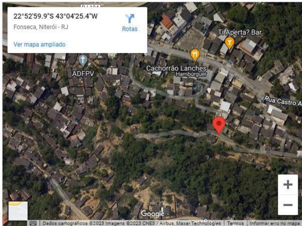
Figura 4 – Travessa 04