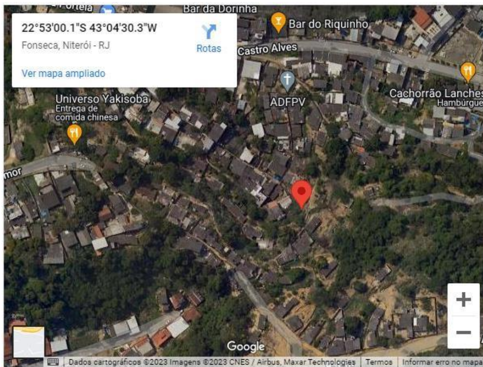
Figura 2 – Travessa Antônio Alves

Empresa Municipal de Moradia, Urbanização e Saneamento - EMUSA