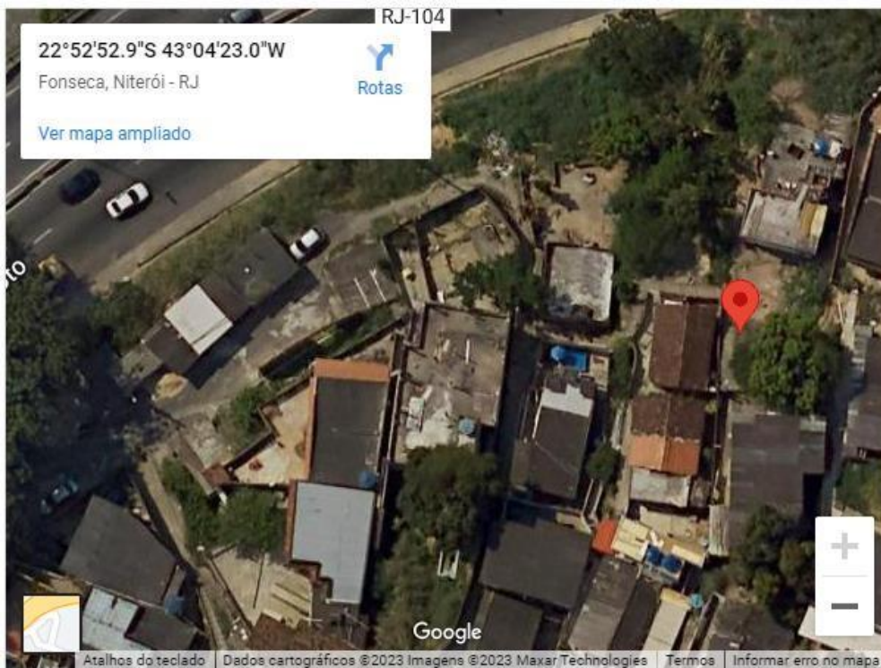
Figura 6 – Travessa S

Empresa Municipal de Moradia, Urbanização e Saneamento - EMUSA