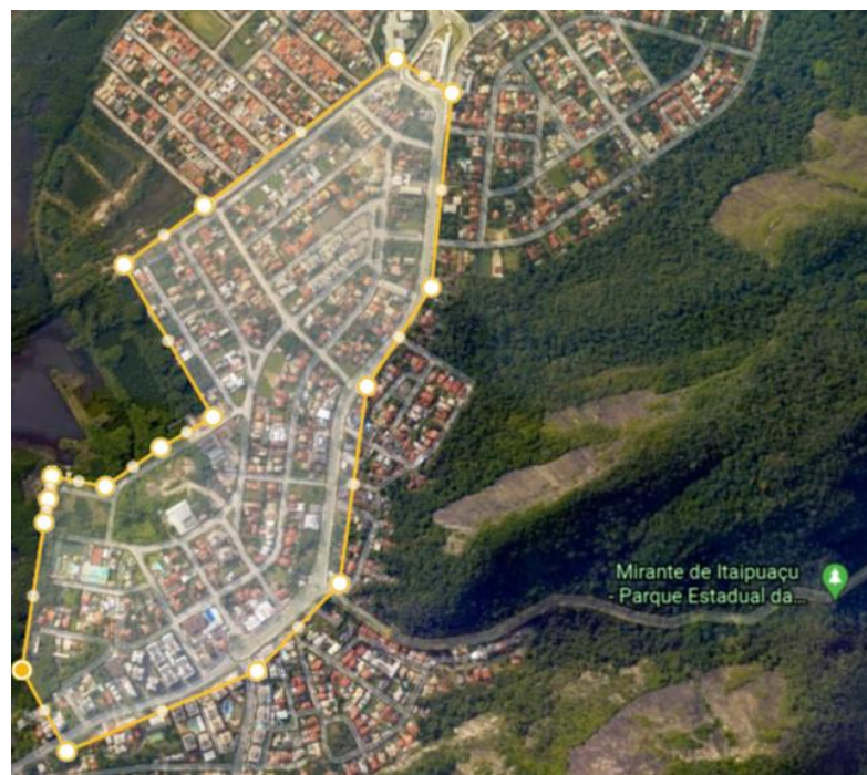
Figura 2 – Delimitação da bacia de contribuição da Estrada da Serrinha.

Para a determinação da área real da bacia de contribuição, traçamos a seguinte área conforme a figura 2.