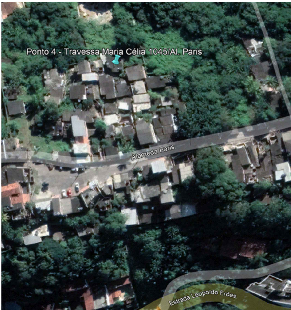
LOCALIZAÇÃO APROXIMADA DO PONTO DE OBRA SEM ESCALA