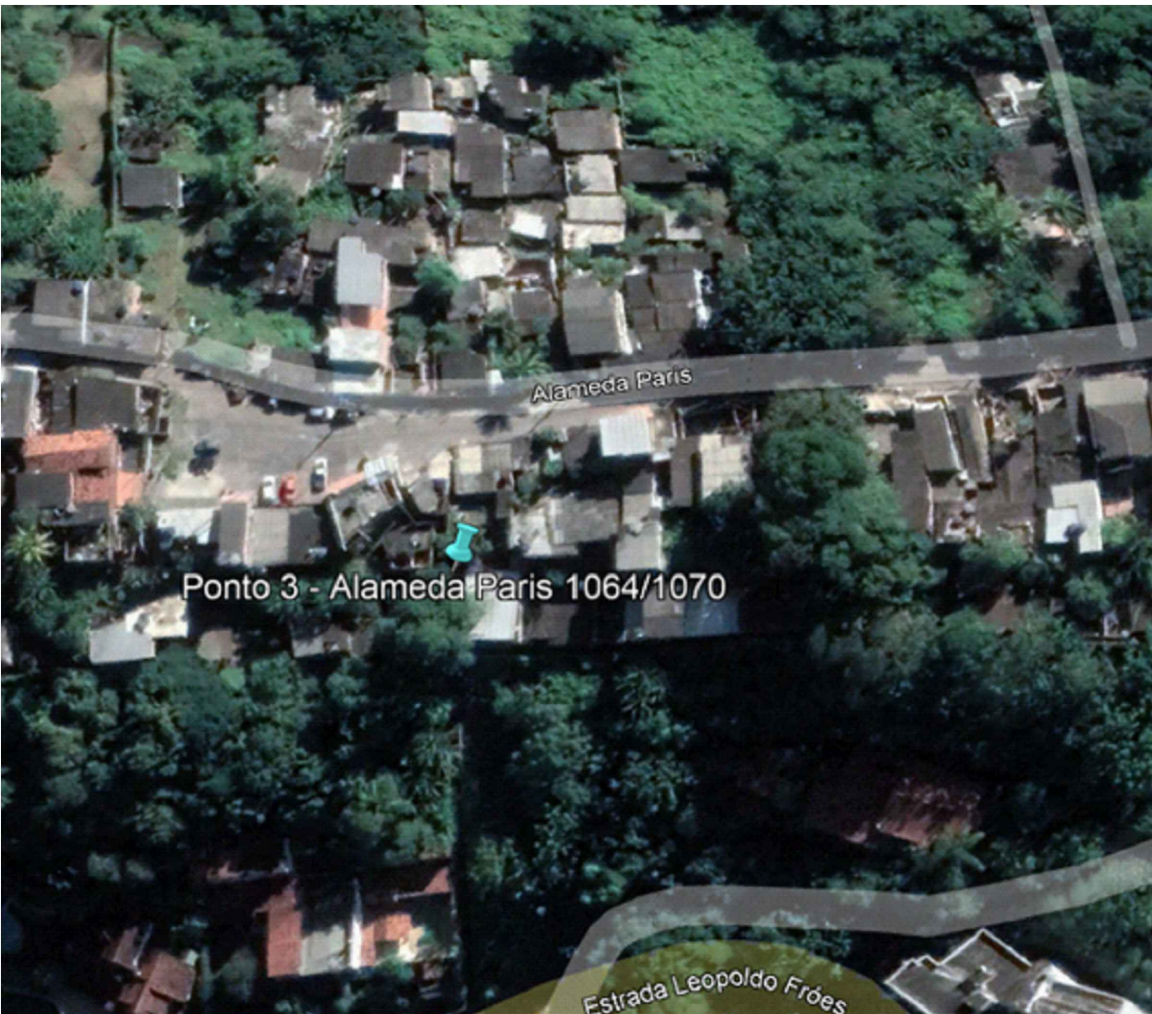
LOCALIZAÇÃO APROXIMADA DO PONTO DE OBRA SEM ESCALA