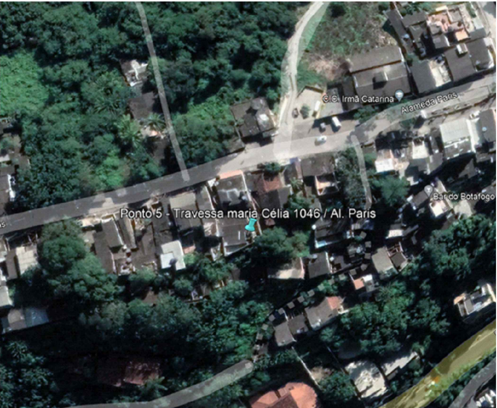
LOCALIZAÇÃO APROXIMADA DO PONTO DE OBRA SEM ESCALA