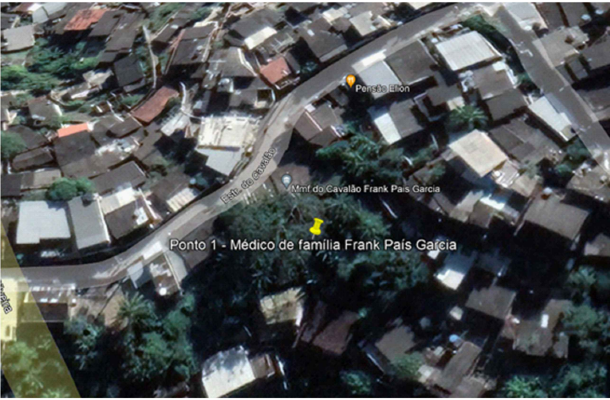
LOCALIZAÇÃO APROXIMADA DO PONTO DE OBRA SEM ESCALA