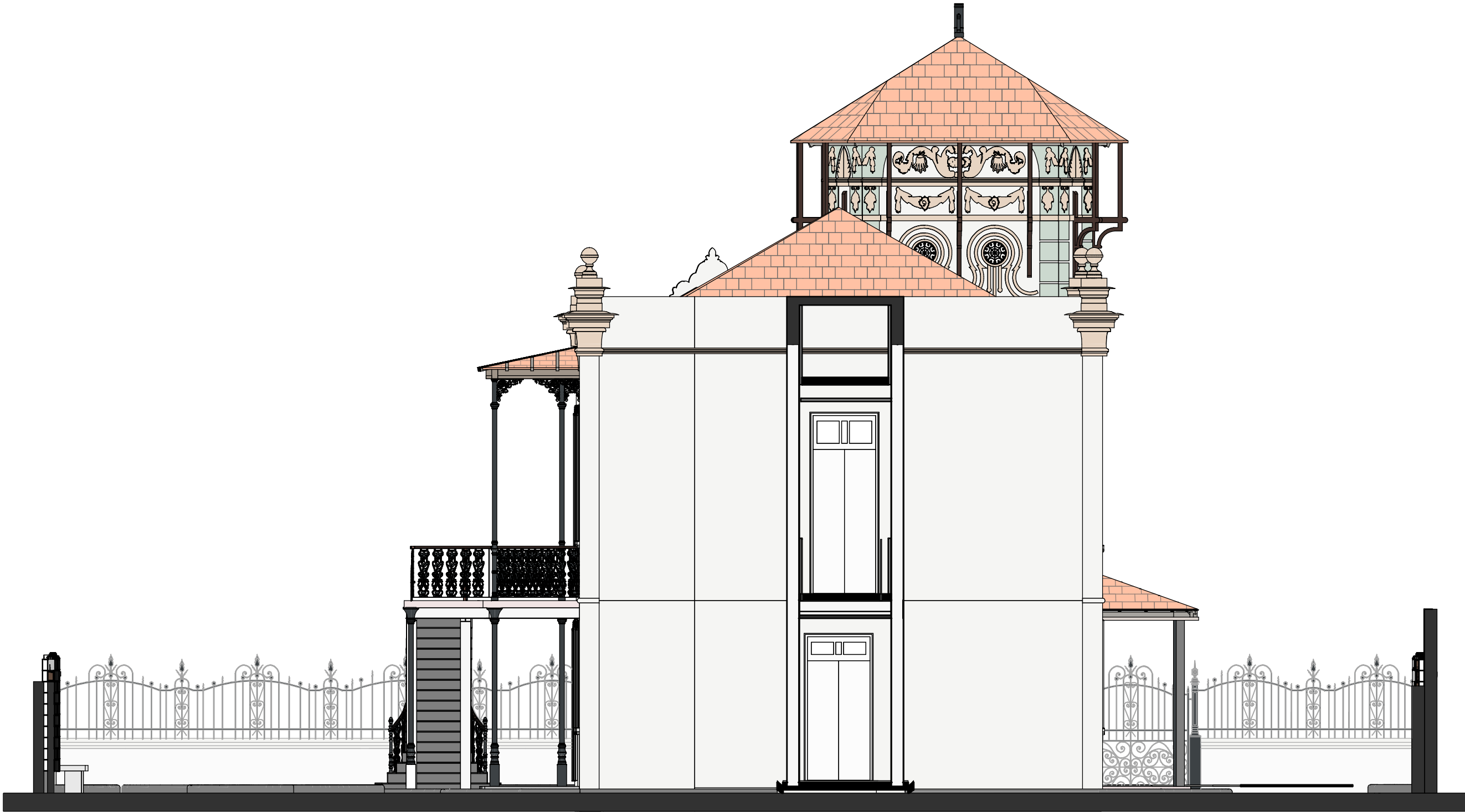
1 FACHADA POSTERIOR 1 : 75

1 - PARA MAIS INFORMAÇÕES À RESPEITO DA RECUPERAÇÃO DOS MATERIAIS DA FACHADA DEVERÁ SER CONSULTADO O DOCUMENTO 0025-DT-ARQ-PB-002_R0 (DIRETRIZES DE RESTAURO)