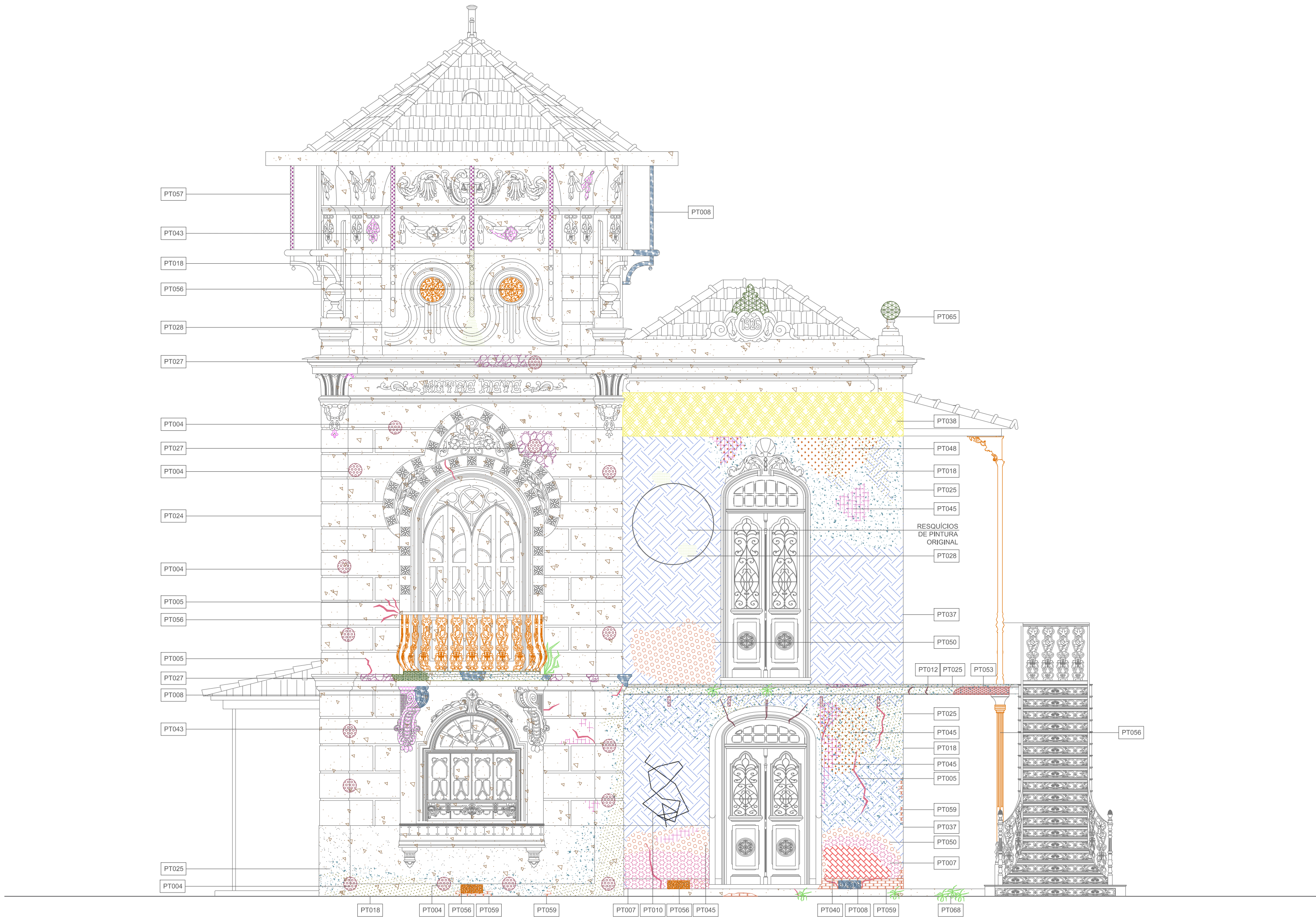
1 FACHADA FRONTAL ESCALA: 1/50