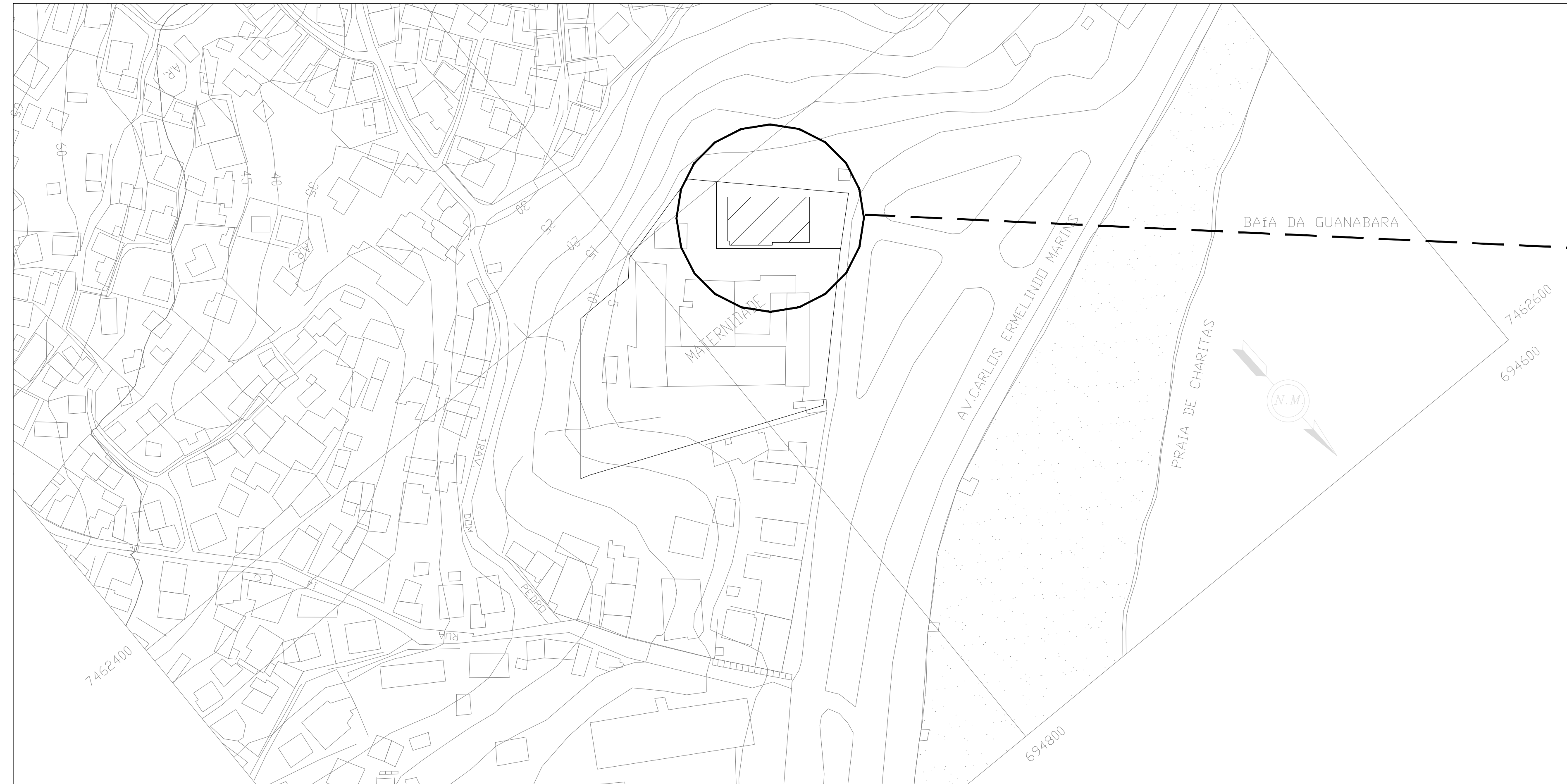
PLANTA LOCALIZAÇÃO ESC.: 1/1000