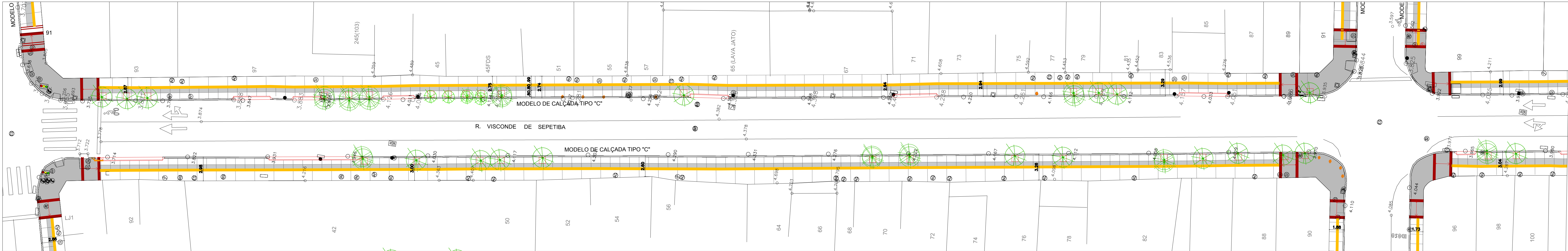
RUA VISCONDE DE SEPETIBA ESC: 1/200