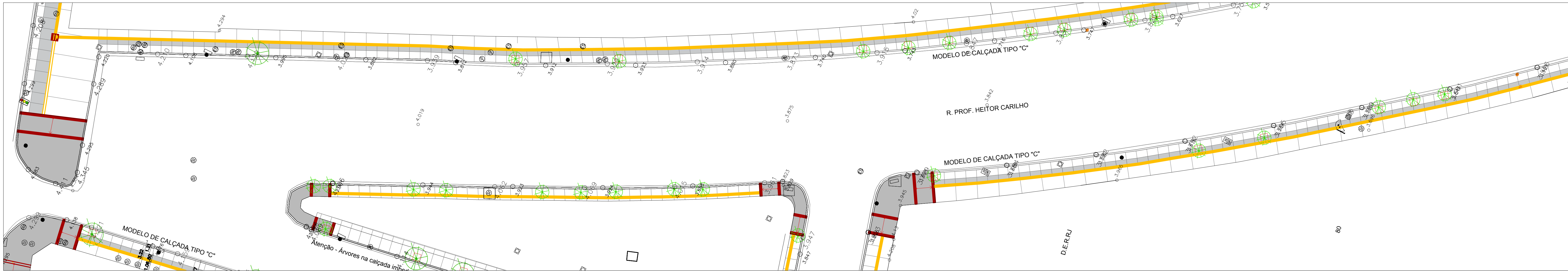
RUA PROF. HEITOR CARRILHO ESC: 1/200