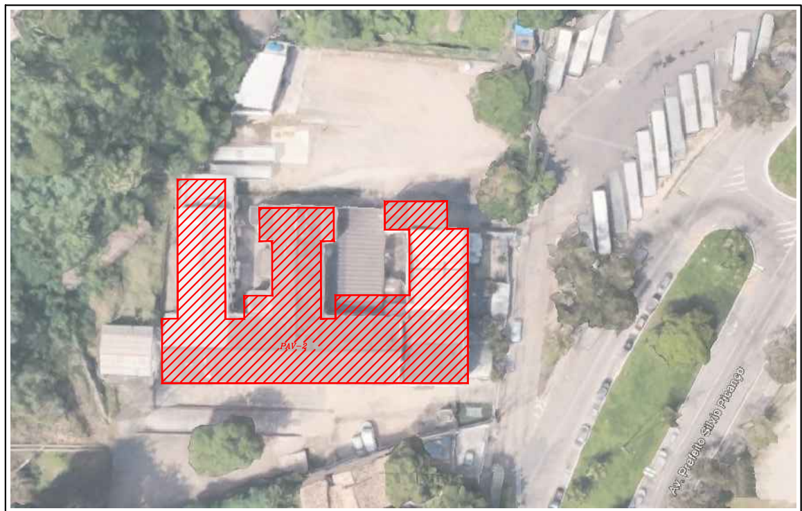
LOCALIZAÇÃO (PAV-2) ESC.: 1/1000

PAV. 1: 2.030 m² PAV. 2: 1.550 m² PAV.TÊC.: 120 m² TOTAL: 3.700 m²